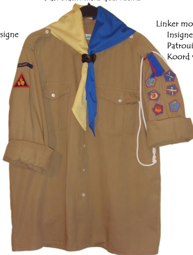
Figuur 1 Voorbeeld Uniform Indeling

Insignes Patrouille lintje Koord voor de P.L.